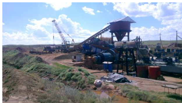
Испытания опытно промышленной установки (2013г.)