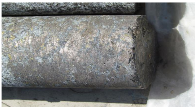
Керновая проба сульфидных руд

На месторождении выделено 2 дополнительных перспективных участка, на которых были найдены ареолы магнитных аномалий, аналогичные основному участку месторождения. Таким образом, запасы объекта могут быть значительно увеличены.